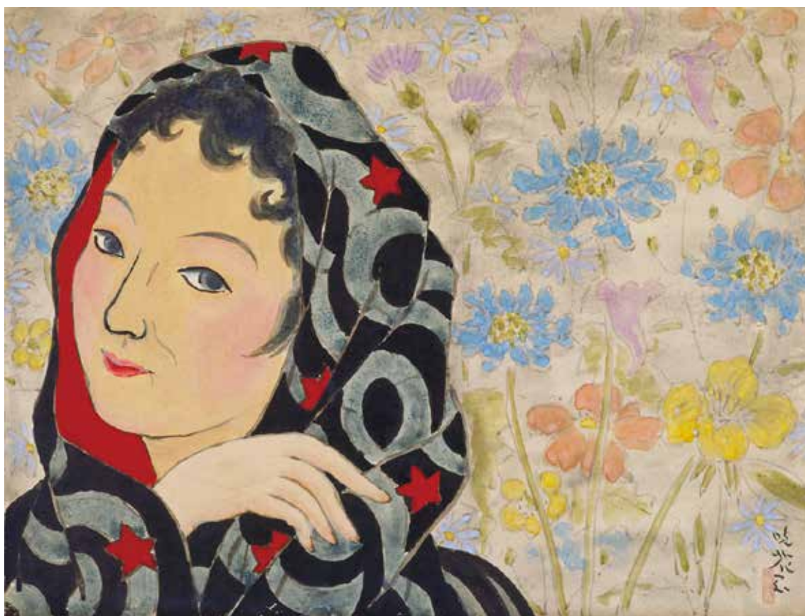
野長瀬晩花《女優》1947年 顔料、紙