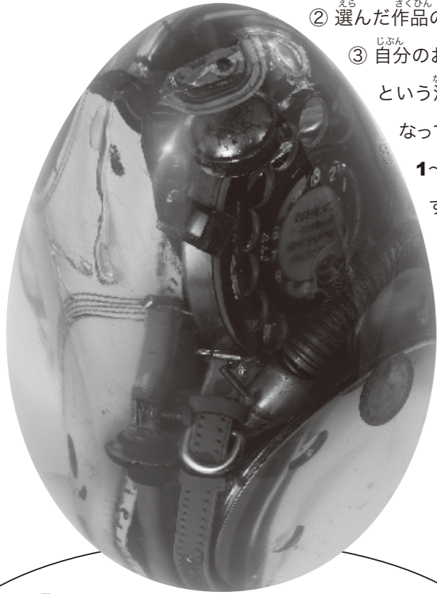
なかにしなつゆき 中西夏之 《コンパクト・オブジェ(たまご)》 1962