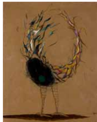
《しゃも》1957（昭和32） 油彩、キャンバス 65.2×48.5