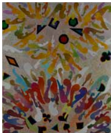
《分裂》1992（平成4） アクリル絵具、キャンバス 194.3×162.2