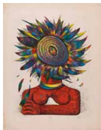
《インディアン》1956（昭和31） 石版、紙 48.8×39.0