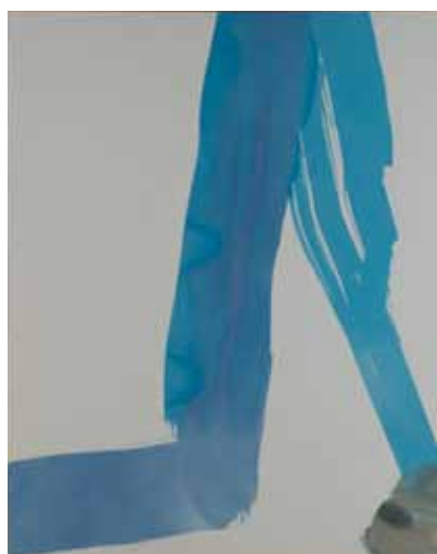
《Painting (DF1005)》1965（昭和40） 油彩、キャンバス 161.5×130.5