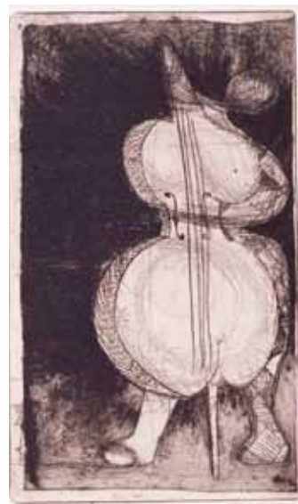
《深夜のセロ弾き》1954（昭和29） 銅版、紙 18.3×10.6