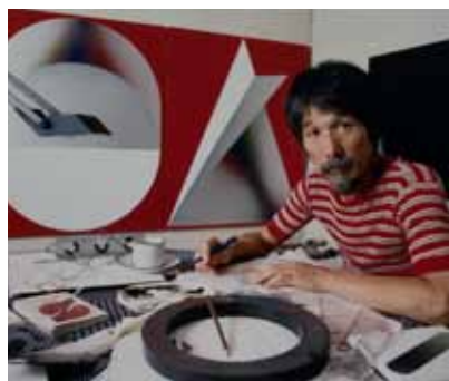
畑祥雄「ちょっと他所いきの自画像」より「泉茂」 1980（昭和55）写真、紙 40.0×50.5