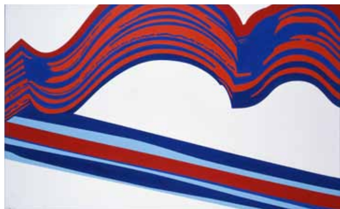
《Painting(FS2008)》1967（昭和42） 油彩、キャンバス 154.0×249.5