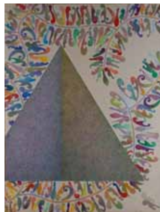
《鎮魂歌》1988（昭和63） アクリル絵具、キャンバス 260.0×195.3