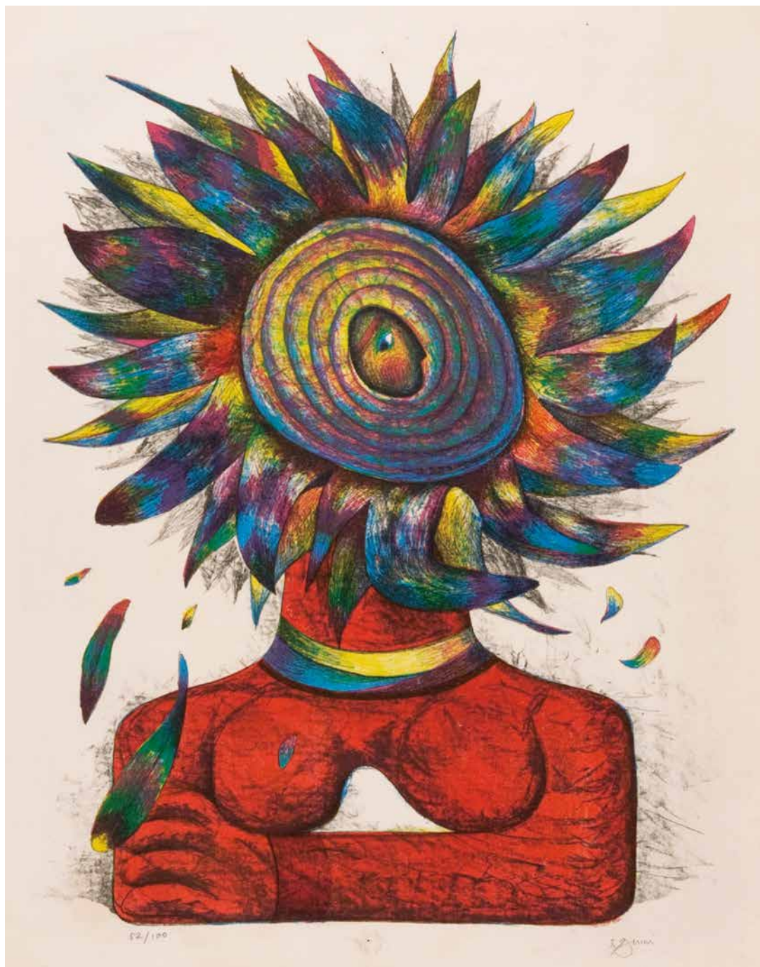
《インディアン》1956年 石版、紙 48.8×39.0cm