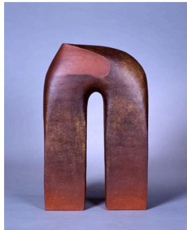
鈴木治 《馬》 1984年