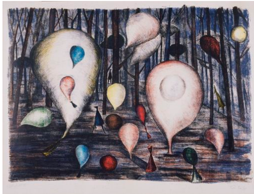
瑛九 《旅人》 1957年