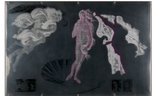
森口宏一 《ポッティチェリ・ヴィナスの誕生より》 1967年