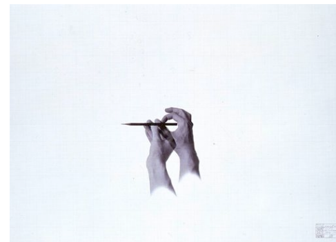
木村秀樹 《Pencil 2-3》 1974年