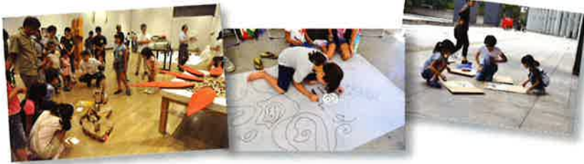
写真は、これまでに実施したワークショップ

京都府生、バルセロナ在住。日本でグラフィックデザイン、版画を学んだ後、スペインに渡西。バルセロナで彫刻、視覚メディアを使った空間芸術をマサナ美術学校で学ぶ。バルセロナのアートセンター、アンガールのスタジオプログラムでの制作活動をふりだしに、欧米日本各地でアーティスト・イン・レジデンスに参加し、滞在する場所から発想をえた作品を多く制作。特に住民参加型プロジェクトはここ数年の活動の中心になっている。