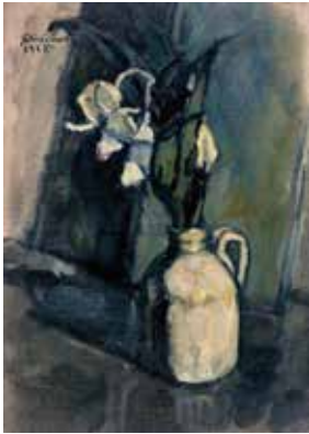
▲ 藤森静雄 《花》 1915年 油彩、キャンバス 当館蔵

当館コレクションを中心に、稀少な個人コレクションを交え、「大正の異色画家たち」展を特別展「動き出す! 絵画 モネ、ゴッホ、ピカソらと大正の若き洋画家たち」と同時開催します。