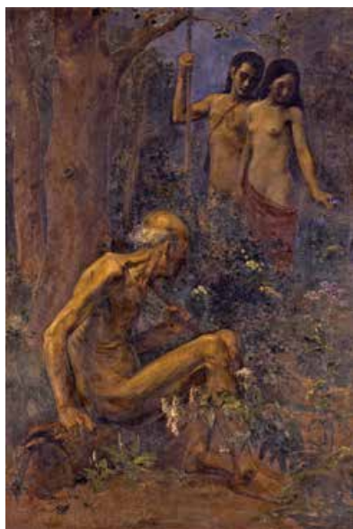
4. 中村 不折 (NAKAMURA Fusetsu / 1866-1943) 《白頭翁》1907 (明治40) / 油彩、キャンバス/ 200.2×136.6 / 個人蔵