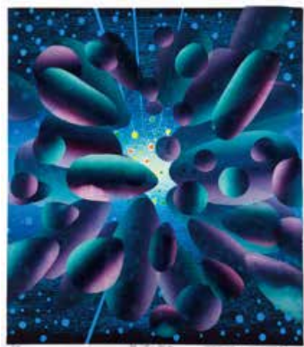
6. 吹田 文明 (FUKITA Fumiaki / 1926- ) 《銀河の創世》 1982 (昭和57) / 木版、紙/74.4×63.4