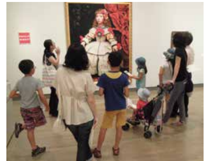
▲ こどもギャラリートーク 昨年度の様子

和歌山県民文化会館「アート・ワークショップ」係(073-436-1331)まで。