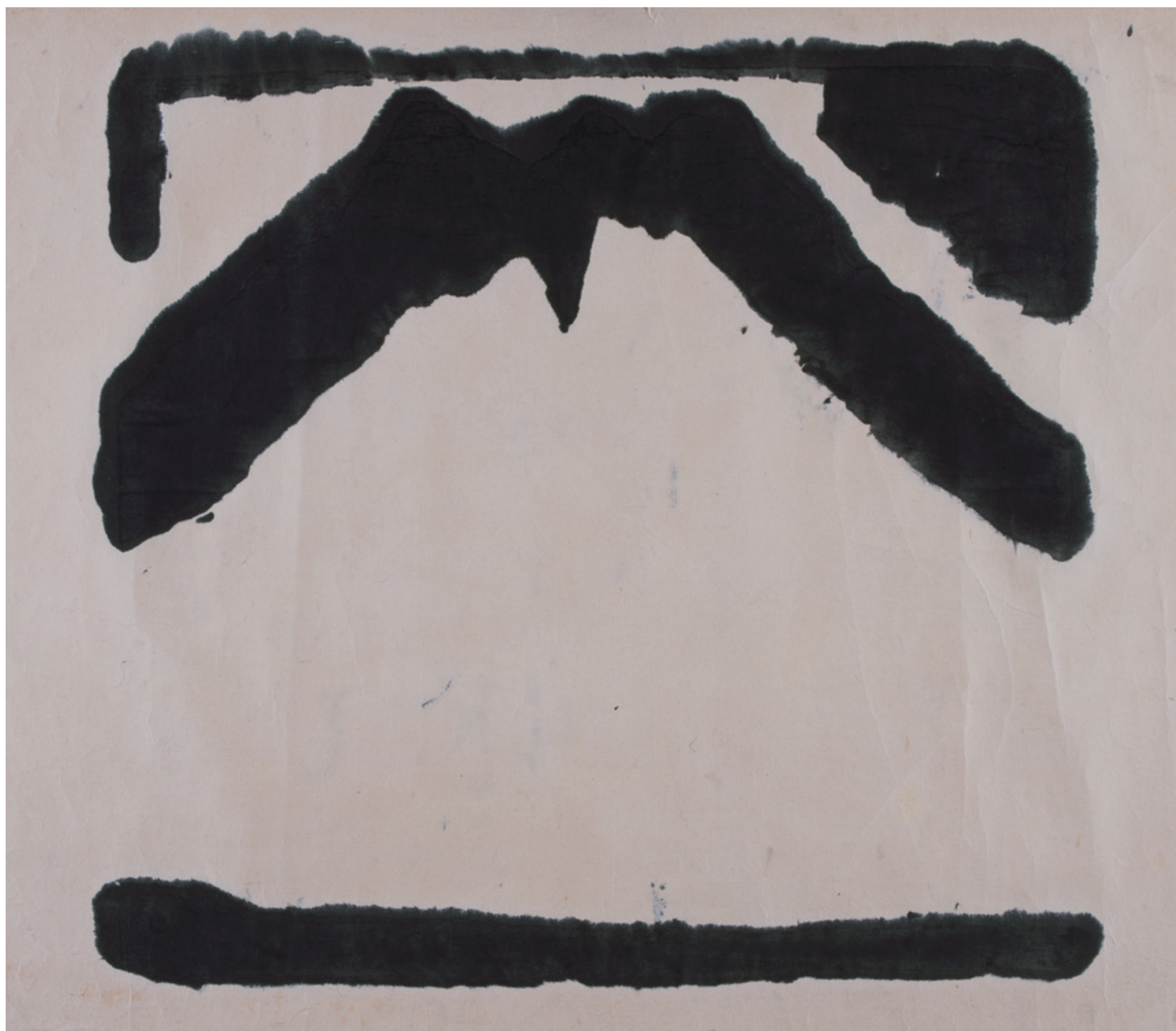
上阪雅人「富士山」1960 木版、紙