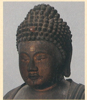
阿彌陀如来坐像 和歌山県立博物館保管

和歌山県内には、全国的に見ても、非常に多くのすぐれた文化財が残されています。この企画展は、夏休みの子ども向けに、文化財の種類や見方をわかりやすく解説します。