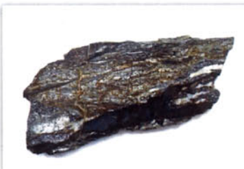
地震の化石「シュードタクライト」

石がわれると地震が起こる!?「地震の化石」が自然博物館にやってくる!身近なようで意外と知らない地震のひみつを、地形模型や標本を展示してご紹介します。