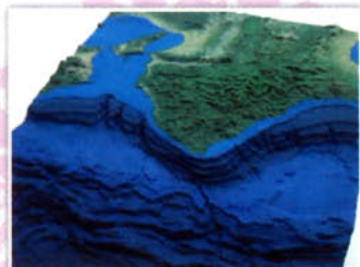
紀伊半島のジオラマ