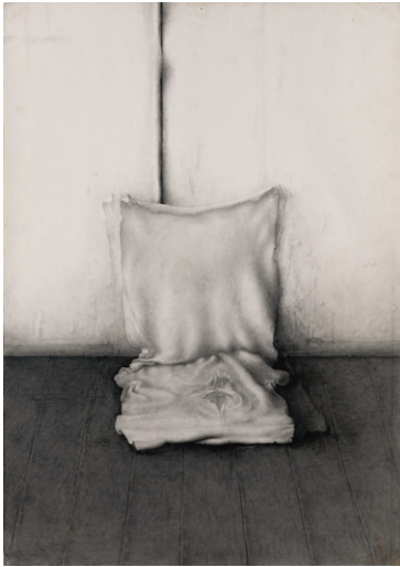
4. 妻木良三《untitled》1998年 鉛筆、紙 個人蔵

掲載用画像については広報担当にお問い合わせください。 *文字のせ、トリミング等はお遠慮ください。