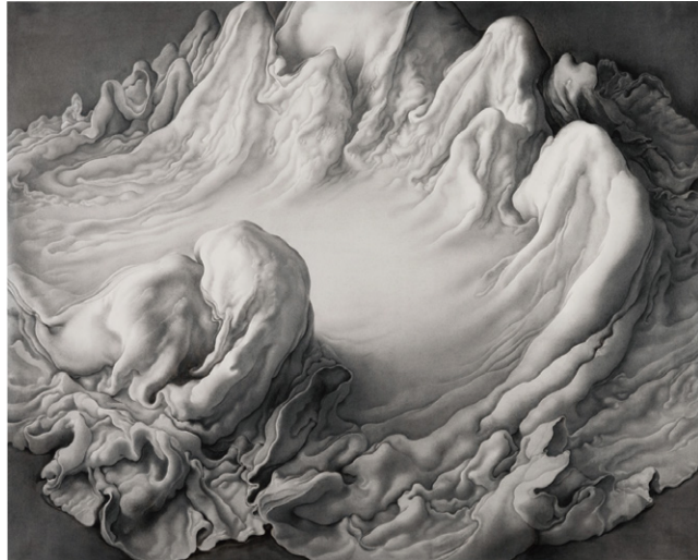
5. 妻木良三《境現の巖 III》2006年 鉛筆・黒鉛・墨・アクリル絵具、紙 個人蔵