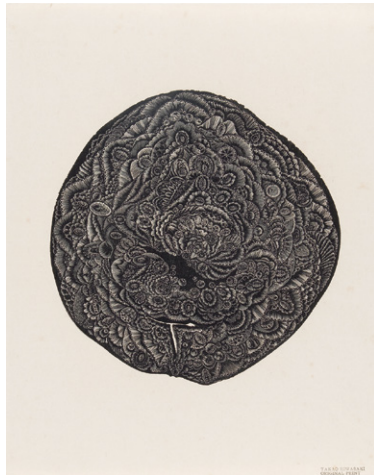
9. 日和崎尊夫《詩画集『卵』より1.見つめる・・・》 1970年 木口木版、紙 和歌山県立近代美術館蔵