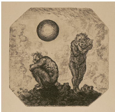
8. 岸田劉生《『天地創造』より欲望》 1914年（1975年刷）銅版、紙 和歌山県立近代美術館蔵