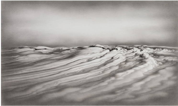
6. 妻木良三《始景 I》2014年 鉛筆、紙 個人蔵