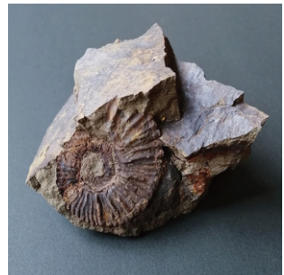
2. アンモナイトの化石 (妻木良三さん採集)