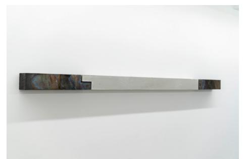
②橋本知成《Untitled》2022年 12.5×260.5×12.5cm 個人蔵