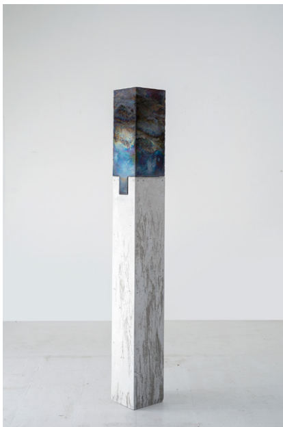
③橋本知成《Untitled》2021年 166.0×20.0×20.0cm 個人蔵