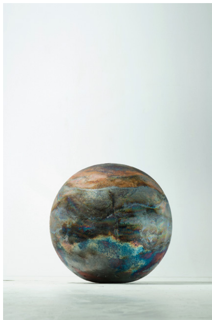
④橋本知成《Untitled》2023年 105.0×105.0×105.0cm 個人蔵