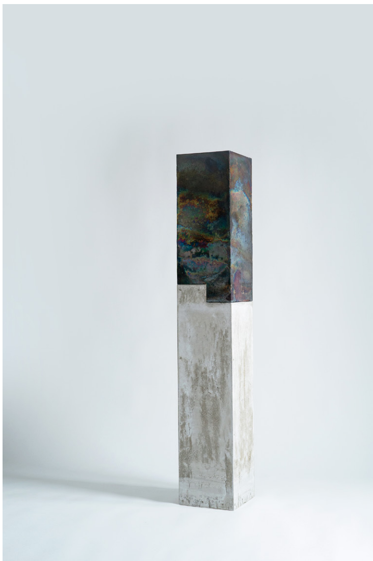
①橋本知成《Untitled》2021年 143.5×24.0×24.0cm 個人蔵