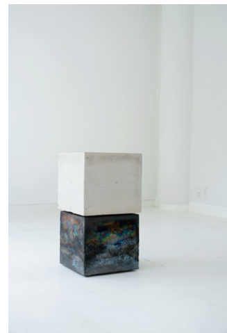
⑨橋本知成《Untitled》2022年 76.0×41.0×41.0cm 個人蔵