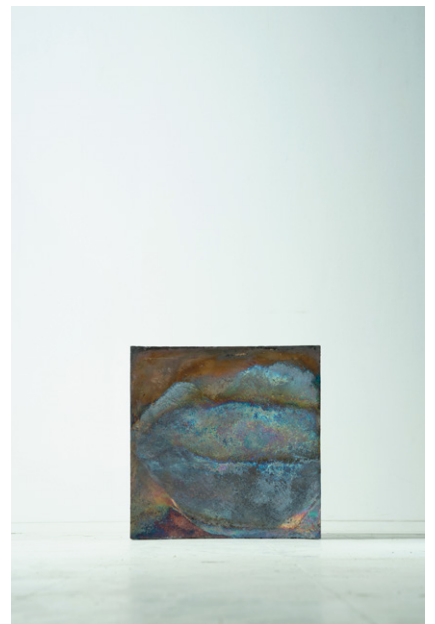
⑤橋本知成《Untitled》2023年 59.0×61.0×61.0cm 個人蔵