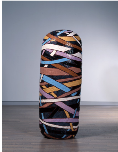
⑦金子潤《Tall DANGO》1986年 180.0×66.0×66.0cm 当館蔵