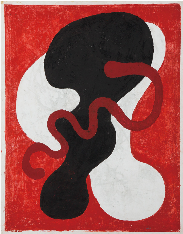
①恩地孝四郎《フォルムNo.14 グロテスク (II)》1952年 マルチブロック、紙 当館蔵