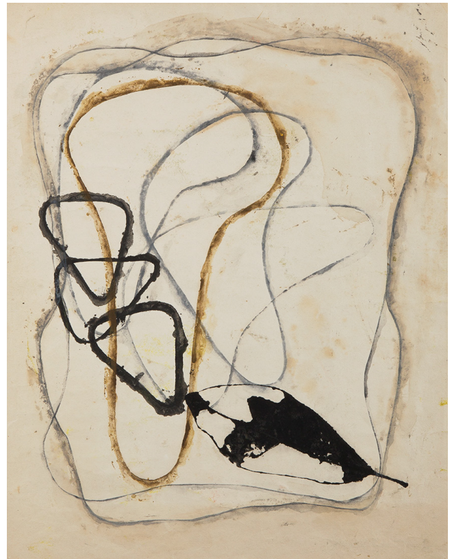
②恩地孝四郎《ポエムNo.22 葉っぱと雲》1953年 マルチブロック、紙 当館蔵

掲載用画像については広報担当にお問合わせください。 文字のせ、トリミング等をご遠慮ください。