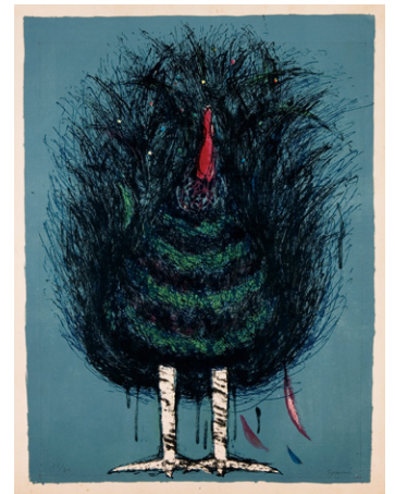
⑤泉茂《七面鳥》1958年 リトグラフ、紙 当館蔵 前期展示